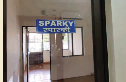
Facilities at kennel