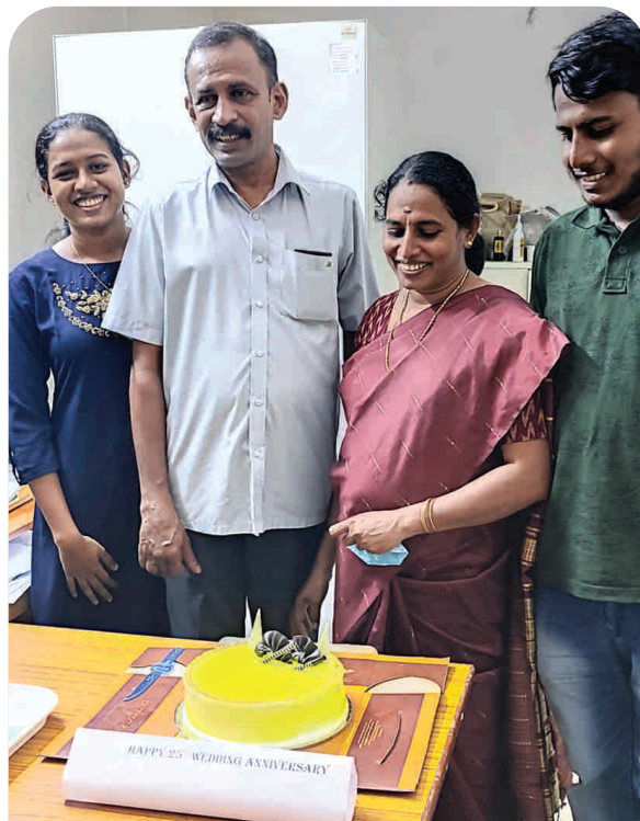
25th Wedding Anniversary