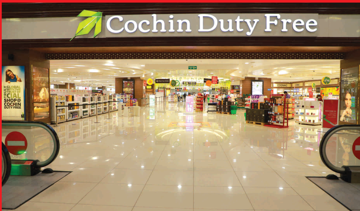
Cochin Duty free Shop

Apart from pre-ordering facility, CDRSL plans to introduce the advance booking facility from October 2021. The tourist passengers moving out of India for short trips can also avail the advance booking facility at the departure shop. It will ensure that they can book all discounts and avail quick delivery while returning to India.