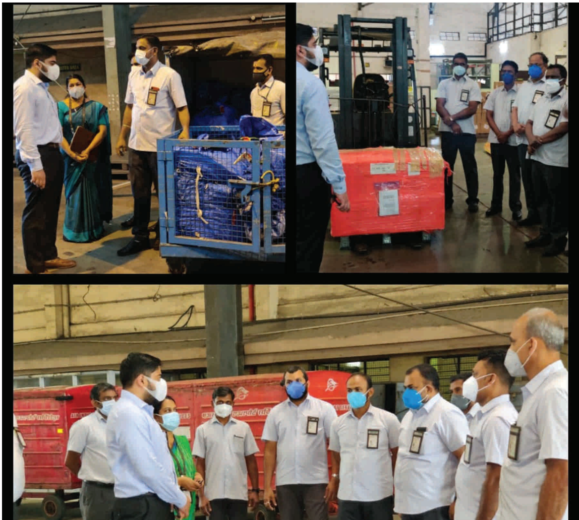
CIAL MD S Suhas interacts with Cargo Employees